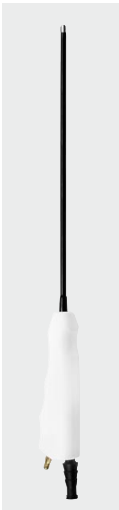
125-501-018 180 mm Absaug Instrument, gerade, biegsam Suction-Coagulator, straight, malleable