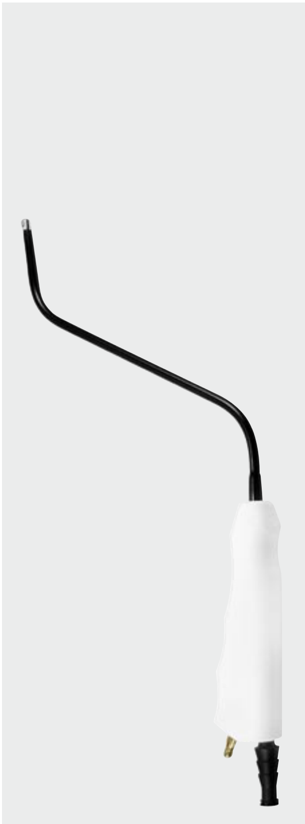
125-503-011 110 mm Absaug Instrument, 2x gewinkelt Suction-Coagulator, 2x angled

Non-Stick Arbeitsende verhindert das Ankleben von Gewebe Non-Stick tip to eliminate tissue sticking