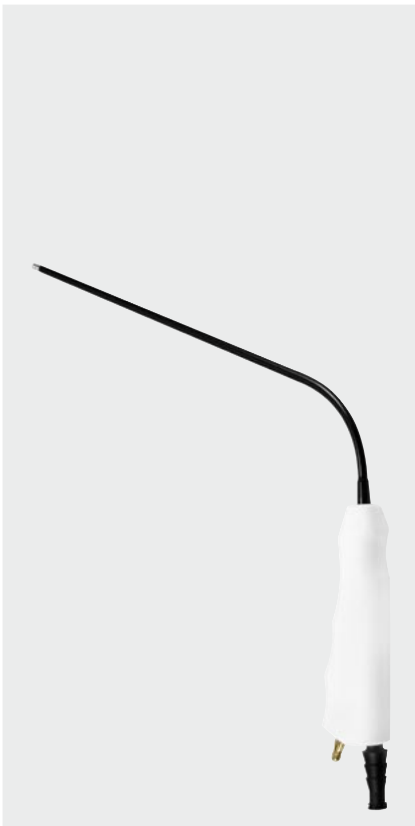
125-502-018 180 mm Absaug Instrument, gewinkelt Suction-Coagulator, angled